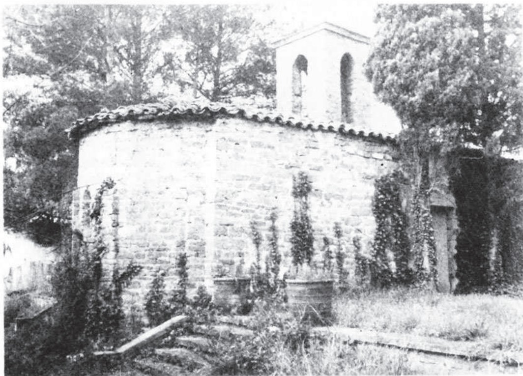
Sant Jaume dels Comtals.