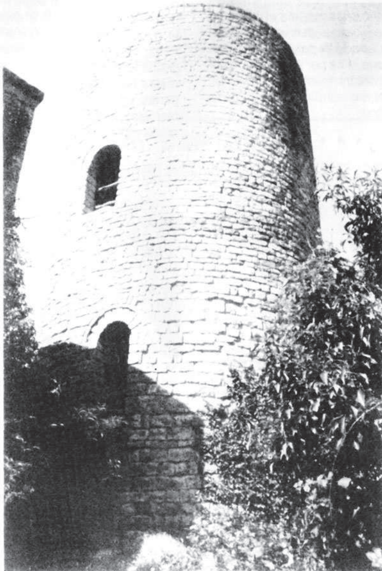
Torre de l'homenatge