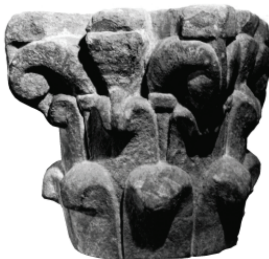
Capitell número d'inventari 4187

Els capitells del primer grup, seguint les característiques de l'ordre corinti de tradició califal en què s'inspiren, tenen forma troncocònica que passa de la base circular fins a la part superior, quadrada, resolta amb tres daus per cara amb volutes als dels angles i un element decoratiu complementari al dau central. Així es resol el pas formal dels aproximadament 20 cm de diàmetre a la base fins al quadrat de 25 cm de la superfície superior. En el tambor del capitell la decoració s'organitza en dos registres superposats de vuit fulles d'acant intercalades les del segon nivell entre les del primer. Les fulles creixen amunt i es dobleguen cap enfora i avall en el seu acabament. Tots aquests elements decoratius estan tractats de manera molt sintètica, elemental, cosa que permet mantenir el dubte expressat per diversos autors sobre si estem amb obres inacabades. Fins i tot entre un i altre d'aquests capitells sembla que ens trobem amb estadis més o menys acabats del treball de l'escultor. D'entre les fulles del segon registre es remarquen unes tiges que sostenen l'arrencada dels elements decoratius que arribaran fins als daus de les arestes. El tractament de la decoració en aquest sector ens dóna la diferència entre els tres capitells: la forma com