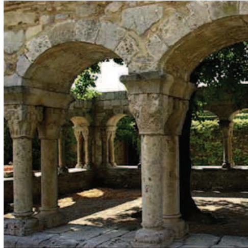
Claustre del convent de Sant Domènec.

Finalment, i abans del retorn cap a Manresa, visitàrem el Monestir de Sant Quirze de Colera, primitiu exemple d'edifici monàstic d'època carolíngia fundat al segle VIII. No obstant l'any 935 es va consagrar una nova basílica, que és la que veiem avui en dia, dedicada a Sant Quirze i Sant Andreu. El Monestir està en obres des de fa temps ja que s'hi estan portant a terme diverses excavacions arqueològiques.