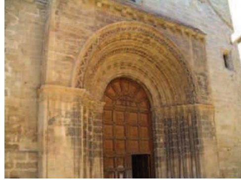
Església de l'Assumpció.