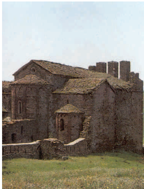
Santa Quirze de Colera.

La Serra de l'Albera (Alt Empordà). 29 de maig de 2005