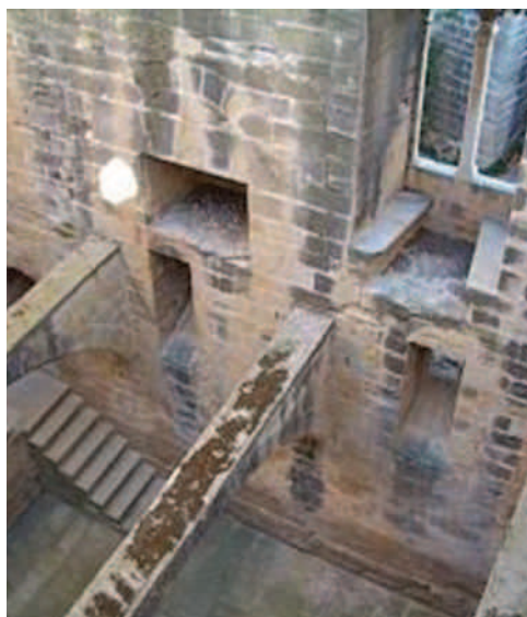
Interior del Castell Zona que pertanyia el Bisbe.