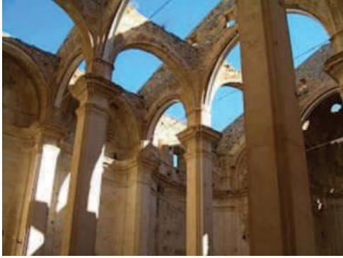
Corbera d'Ebre.