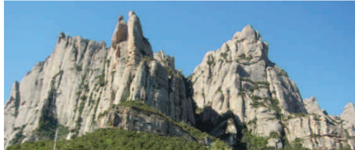
Muntanya de Montserrat.