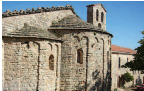
Santa Cecília de Montserrat.

Després d'esmorzar ens adreçarem ja cap al Monestir de Montserrat on ens esperava la visita al Museu, que des de l'estiu del 2004 estrena nou emplaça-