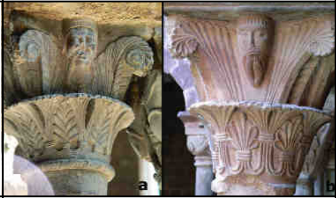
Fig. 2. a) Ripoll b) L'Estany

clares diferències entre si, palesant mans més destres i d'altres més mediocres. Dins la hipòtesi d'un tallador sorgit de Ripoll, la sèrie es pot llegir com un motiu més o menys ben treballat per un mestre i diverses còpies amb derivacions decoratives per part d'un o diversos aprenents.