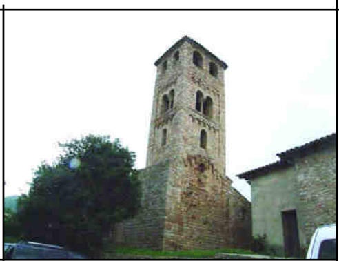
Sant Vicenç d'Espinelves

Els seus volums exteriors, les teulades, els porxos, campanars, façanes i absis, al mateix temps que ens expliquen tant bé com és l'interior, arriben a formar part dels camps, turons, muntanyes i roques que l'envolten i, si cal, complementant-los fins al punt que si no hi fossin els trobaríem a faltar.