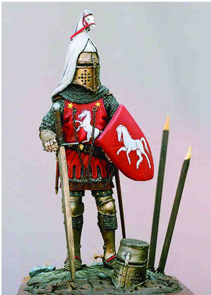
ROMEO MODELS (ITÀLIA) Escultor: Gianni La Rocca Pintor: Aleix Pratdepàdua