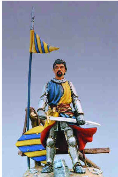
PEGASO MODELS (ITÀLIA) Escultor: Pietro Balloni Pintora: Anna Derqui

A partir de les peces visibles, l'arnès d'aquest cavaller és compost per una cota de malles proveïda de caputxa que, ocasionalment, la duu enretirada deixant el cap al descobert. Les cames, per la seva part, són protegides amb calces de malla. Tant els braços com les cames compten amb la sobreprotecció de peces rígides metàl·liques, lligades amb corretges de cuir, que només protegeixen, atès que no són tubulars, la part exterior de les extremitats: guardabraços i amambraços a les superiors i cuixeres, genolleres i gamberes a les inferiors. El cap, a més de la caputxa de malla, se'l podia cobrir amb un elm de tonell que, en la imatge, reposa als seus peus.