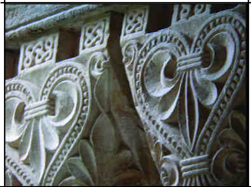
Fig. 6. Flors de lis inverses al W9/w9

Sis capitells escampats tenen uns motius molt comuns en forma de palmetes o flors de lis (Fig. 6). Per la popularitat del motiu als segles XII i XIII es fan difícils de datar amb precisió a partir de la iconografia. L'execució és acurada, i el motiu en si no presenta grans dificultats, poguent per tant ser treballat per un taller local a partir d'un estès patró fix, quasi com una mena d'exercici avançat en l'ofici de tallista. Per l'estil i l'estructura aquest taller sembla no haver executat cap altra sèrie de