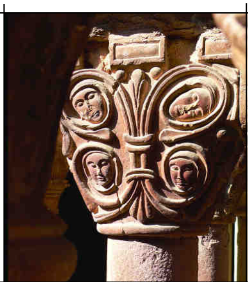
Fig. 11. Màscares del capitell n8: les ànimes del Paradís?

Encara que plantejat com a hipòtesi i seguint amb els nombrosos dubtes que sempre ha generat l'estudi d'aquest claustre, aquest arti-