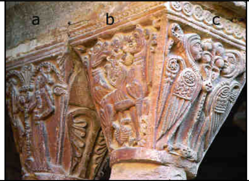
Fig. 7. Dos capitells "Cònics"; a: motius costumistes (E6), b: extret de tèxtils orientals i c: mitològic (e6)

El taller es pot subdividir en grups segons temes i tics de cisell, que tant poden deure's a diverses mans com a campanyes distanciades.