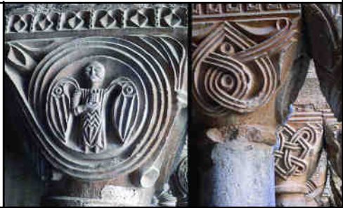
Fig. 9. S2, un dels exemples més reeixits i coneguts dels "medallons", i una sèrie de "llaceries" gòtiques a la galeria S

vint llaceries que ja no poden dissimular el gòtic d'aquest final del XIII. El motiu bàsic és una línia seriada que arrodoneix el centre del capitell i sovint enllaça les seves cares, deixant un medalló central ocupat per elements altament simbòlics (nus de Salomó a s2, gall a s7), heràldics (S3 i s3) o formant part de la mateixa decoració (S6), encara que també n'hi ha amb filigranes geomètriques a cada cara. Quasi que es podrien subdividir en dos tallers temàtics (medallons amb símbols i filigranes), però els motius merament decoratius, vegetals o geomètrics, són compartits sense distinció. Les tècniques d'escultura no són gaire elaborades i recorren a la successió de línies o al trepant, però el resultat és net i gràfic, potser per aconseguir l'encàrrec amb una certa rapidesa (Fig.9).