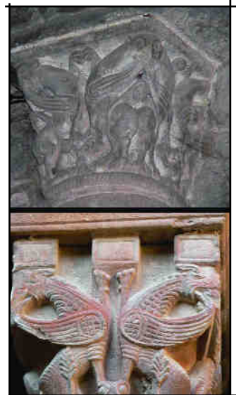
Fig 4. Capitell gironí i el seu germà estanyenc N4

XIII, i dins una línia decorativa a la qual es relegarien els capitells de la banda del pati acompanyant els capitells historiatos. Els grius, amb potes i ales, terrestres i celestes, solen significar la naturalesa humana i divina de Crist.