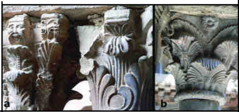
Fig 1. a) l'Estany b) Ripoll

Una segona sèrie de capitells, ubicada a la galeria W, ja va néixer concebuda en tres de les seves cares i per tant és posterior. El motiu és calcat d'un de ripollès: capitell corinti amb una cara amb corona i barba i un fris variable de fulles i palmes (Fig. 2). Tot i presentar una quasi idèntica imatge, els capitells mostren