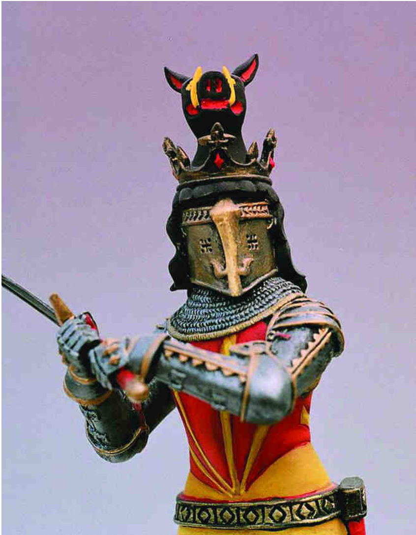
Ralf, lord Basset de Drayton (finals del segle XIV) VERLINDEN PRODUCTIONS (BÈLGICA/USA) Figura pintada per Joan Palou