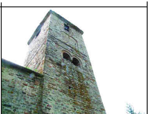
Sant Sadurn d'Ossormort