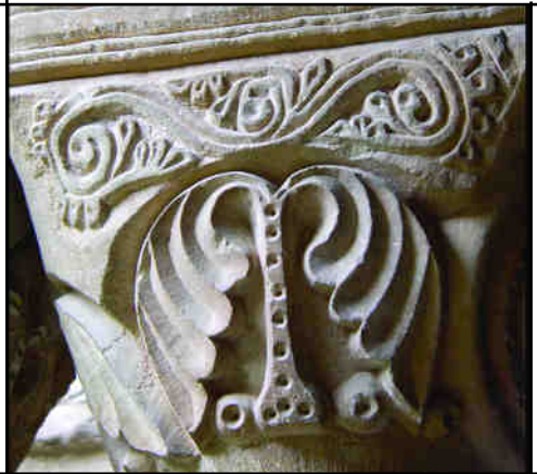
Fig. 10. S3: sanefa afegida tardanament a un capitell inicialment adossat

L'heràldica d'alguns dels capitells revela el mecenatge de les obres finals del claustre i una datació al darrer quart del segle XIII. Un estudi més detallat d'aquesta heràldica ens podria oferir més dades sobre el taller, el moment de la seva aparició i les relacions del monestir amb els poders fàctics en aquest moment clau de passar de priorat a abadia, però molt probablement fou el que acabà tots els "forats buits" per finalitzar definitivament les galeries del claustre, versemblantment en poc temps.