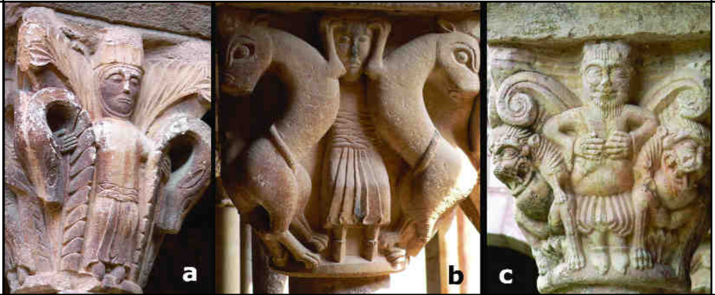
Fig. 5. a) Capitell e9 b) Capitell W3 c) El mateix motiu, molt més elaborat, a Serrabona