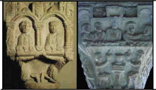
Fig. 3. a) Presbiteri de l'església b) Claustre; el mateix motiu, tot i que amb diferències

Els nou capitells interiors de la galeria nord són els de major qualitat artística, i situen L'Estany entre els escollits monuments del romànic europeu. Mantenen un estil molt unitari, però la filiació sempre ha resultat difícil. A Catalunya mateix només tenen com a germans uns capitells de Sant Feliu de Girona i els de la casa de la Canonja ara al MAG (Fig. 3). Tradicionalment s'havien trobat paral·lelismes amb l'escola tolosana, datant-los a la segona meitat del XII i sense establir una comparació estilística real. Darrerament s'ha sug-