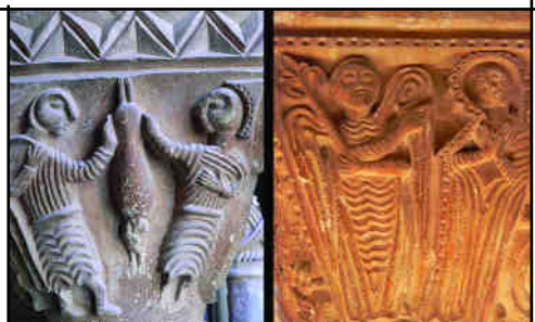
Fig. 8. L'enigmàtica escena del S8 i la segona Anunciació de l'E4, amb els mateixos recursos escultòrics

Sis capitells esparsos entre les galeries S i E donen a un altre taller, ja tardà, que es caracteritza per l'ús de línies paral·leles (com els vestits dels S8 i E4 -Fig. 8) i el quasi abús del trepant per aconseguir fàcils efectes decoratius (S7, E7). Tardà, però de factura primitiva, és difícil de datar, tot i que se situa posterior al taller 7 3 .