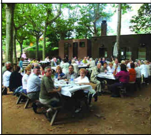
Dinar a Sant Julià de Vilatorrada