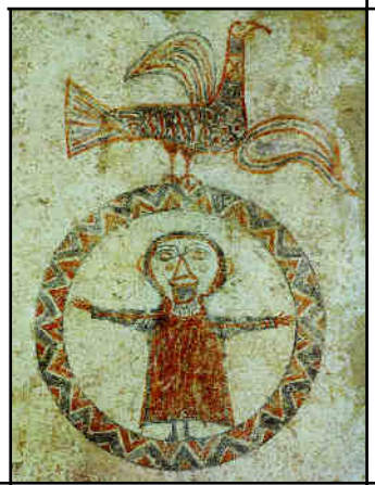
Pintura a Sant Quirze de Pedret

tot va evolucionant agafant formes que, per diferenciar-les de les anteriors, les classifiquem com a "Art Gòtic", en què als seus edificis encara hi trobem formes