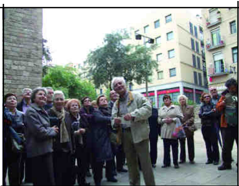
Sant Pau del Camp.