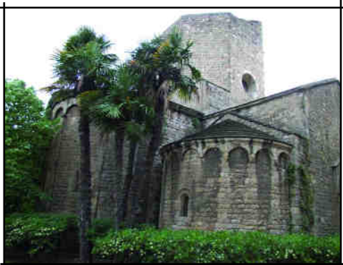
Sant Pau del Camp.

Arribem al restaurant, esplèndid marc modernista de les sales de menjadors a la planta baixa, decorades per l'arquitecte Lluís Domènech i Montaner. Mentre esperem que serveixin el dinar anem admirant la sala del menjador decorat amb alicatats de rajoles a les