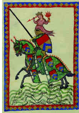
Herr Ulrich von Lichtenstein

El còdex Manesse, conservat a la biblioteca d'Eidelberg, és un bell manuscrit il·luminat, dedicat a Venceslau II, rei de Bohèmia. Va ser copiat a Zuric per encàrrec de la família Manesse vers els anys 1305-1340. Conté 137 miniatures que, encapçalades per la figura d'Enric VI, ens mostren, ja sigui individualment o bé for-