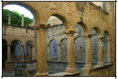
Horta de Sant Joan

gostar de fer-ho amb dues i col·locar-ne un altra plana al damunt d'elles, obtenint així el primer edifici artificial, que nosaltres li diem “dolmen”, i que no és més que un simple pòrtic, la primera estructura. En veient l'èxit estructural aconseguit, va gostar de col·locar uns quants pòrtics més, un darrere l'altre, i va aconseguir construir un corredor cobert, una galeria, un túnel. Tant animat estava, que es va tornar més agosarat i llavors aquests pòrtics els va col·locar en cercle, i va deixar per col·locar una de les lloses dretes de manera que li quedés un forat que feia de porta per ficar-s'hi a dins. Acabava d'inventar-se la “llinda”. En tot això, havien passat milers d'anys per arribar a aquesta evolució i, de nou, nosaltres tornem a classificar l'època dient-li a la carpeta Neolític, (del grec Neos , nou i Lithos , pedra), i fins i tot en una subcarpeta que l'anomenem “Calcolític”.