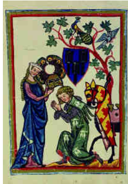
Der Schenk von Limpurg