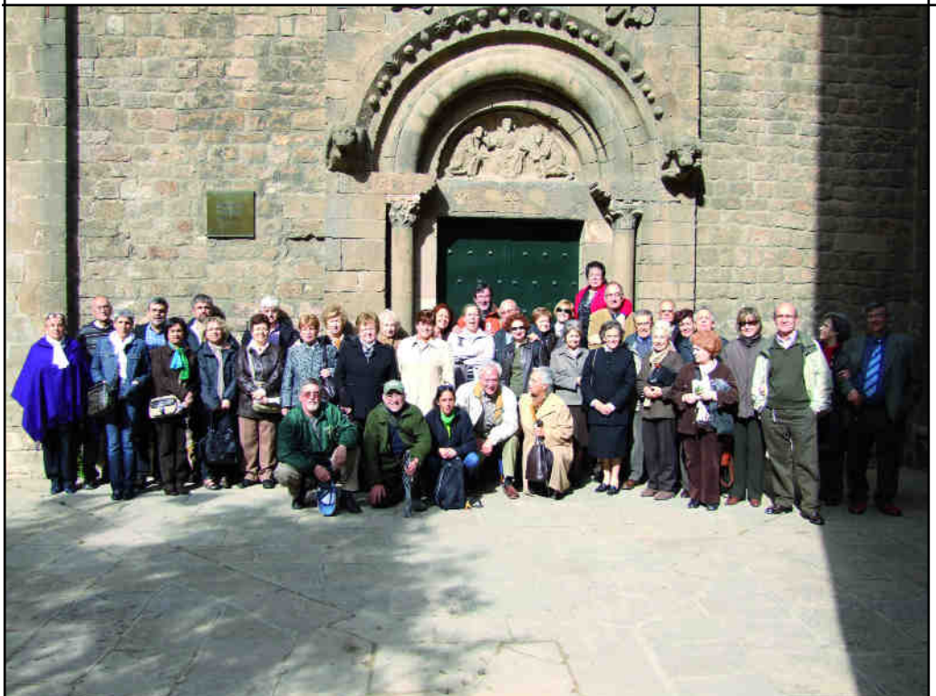
Sant Pau del Camp.

Ens hem desplaçat 40 Amics, i alguns d'ells es queden a la terra.