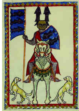
Wachsmut von Künzingen