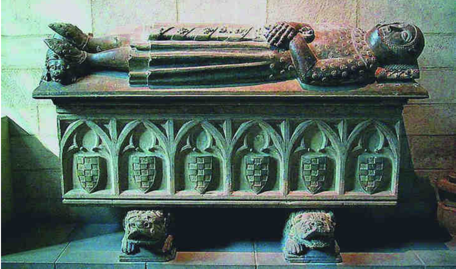
Sepulchre d'Álvar de Cabrera emplaçat inicialment al Monestir de Bellpuig de les Avellanes i actualment conservat a "The Cloisters" de Nova York. Els escuts que figuren al frontal del sepulchre mostren els senyals heràldics dels comtes d'Urgell.

dels genolls, ja que la túnica interna arriba fins al començament de les cames. Seguint la pràctica d'afegir peces rígides de ferro a l'arnès, adoptada vers els darrer terç del segle XIII, també es protegeix les mans amb guantellets i el coll amb una gorgera de notables proporcions. No duu posat cap mena de casc, però, atesa l'època, és molt probable que en duigués un de semblant al que suposadament duia Ramon Folc VI.