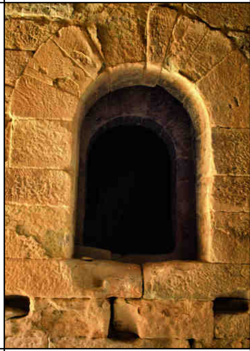
Porta original de la torre.

vament ocupada per diverses edificacions adaptades a les necessitats de cada època, més residencials que defensives.