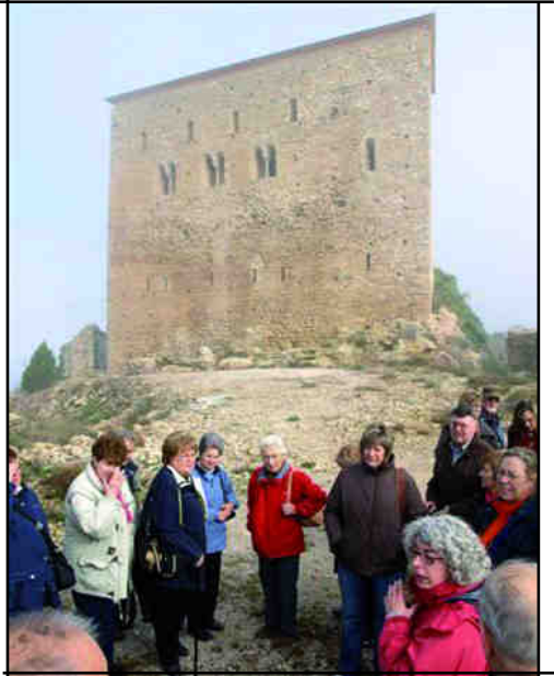
Castell de Llordà.

Al migdia, amb el suport de l'Oficina de Turisme de Guissona, ens vam desplaçar per