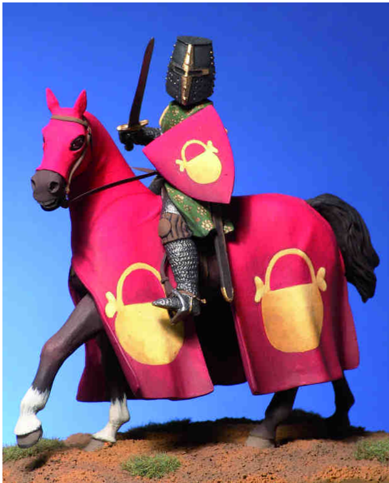
EL VIEJO DRAGÓN MINIATURAS (MADRID) Figura dissenyada i modelada per José Ramón Arredondo Sánchez i pintada per Joan M. Masferrer (Art Girona)

SENYOR DEL CASTELL DE CALDERS DESPRÉS DE 1208