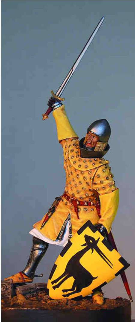
VERLINDEN PRODUCTIONS (USA) Figura pintada per Joan Andreu Palou

Fill d'Àlvar, comte d'Urgell, i de Cecília de Foix, després de protagonitzar diversos fets d'armes, participà en la campanya de Sicília durant el regnat de Jaume II. Allí caigué presoner i fou tancat al castell de Catània, on emmalaltí i morí a principis del 1299. Recuperades les seves despulles pel seu germà Ermengol X, comte d'Urgell, aquest manà que fos sebollit al monestir de Bellpuig de les Avellanes (Os de Balaguer, la Noguera). Conseqüentment, el sepulcre devia ésser esculpit durant els anys transcorreguts entre la mort d'ambdós germans (1299 - 1314).