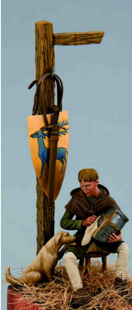
ANDREA MINIATURAS (MADRID) Figura pintada per Joan M. Masferrer (Art Girona)

No podem deixar passar per alt la figura de l'escuder estretament lligada a la del cavaller. Procedent de família noble, quan encara era molt jovenet, els seus pares l'enviaven al castell o palau d'un altre noble o, fins i tot, a la casa reial per rebre la instrucció adient per assolir el grau de cavaller. D'entrada havia de fer de patge i més tard era nomenat escuder. Arribat en aquest punt, era posat al servei d'un cavaller a qui, a partir d'un moment donat, acompanyava arreu on anava formant part del seu seguici. Ell era qui duia la llança i l'escut -d'aquí el nom d'escuder- i qui havia de tenir cura de les seves armes. El seu aprenentatge implicava, entre altres ensenyaments, aprendre bones maneres, muntar a cavall, practicar la caça i, sobretot, exercitar-se en les armes. També aprenia les virtuts cavalleresques i la manera de comportar-se a la cort. En fer els vint-i-un anys, o pocs més, si estava prou preparat, ja podia ésser adobat cavaller.