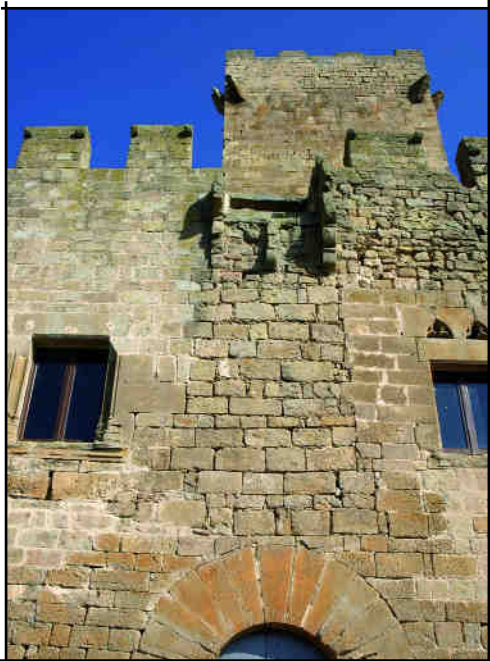
Façana de migdia (detall).

tos per instal·lar-hi aquestes bastides i, a les terres del Sobrarbe, a la província d'Osca, podem veure una fidel reconstrucció d'un cadafal de fusta al castell d'Abizanda.