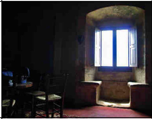
Finestral de la sala (amb festejadors).

ments associats a l'estil de vida aristocràtic. Col·locats aprofitant el mateix gruix dels murs són emprats per les dones per brodar, llegir o escoltar els joglars i per les parelles en el seu festeig. En trobem a infinitat de castells i, a Les Sitges, s'obren a un magnífic panorama sobre la plana del nord de la Segarra.