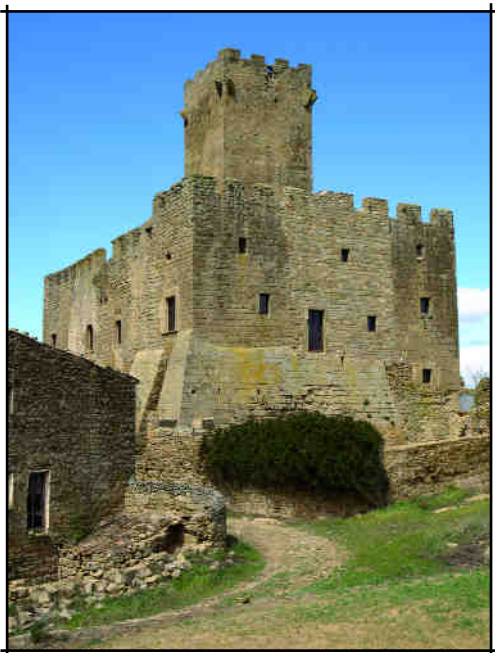
Façana de llevant.

dients defensius típics. A Les Sitges trobem les restes d'un matacà (o lladronera) situat sobre la portalada del costat sud, sobresortint del mur i suportat per tres grans mènsules esglaonades. La seva funció és permetre l'atac vertical contra els possibles agressors del castell; el fet que sigui buit per sota serveix per poder llançar pedres, fletxes, sorra calenta o aigua bullent sobre l'invasor que s'aproximava o pretenia pujar per la paret. En veurem també, per exemple, als castells de l'Albí, la Bisbal, Ratera, la Ràpita, la Bisbal d'Empordà o al Castellet de Foix.