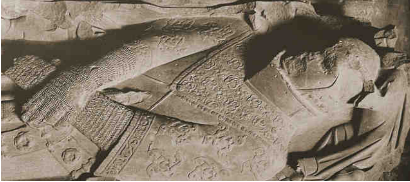
Detall del sepulcre de Ramon Folc VI. Monestir de Poblet.

En morir, el 31 d'octubre de 1320, fou enterrat al monestir de Poblet.