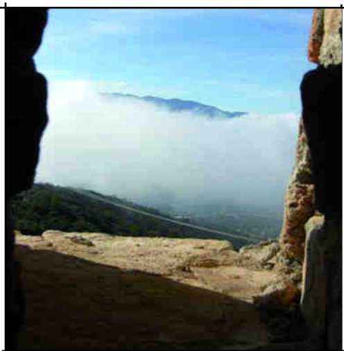
La boira.