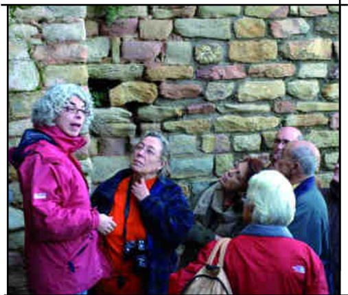
Explicacions de la guia.