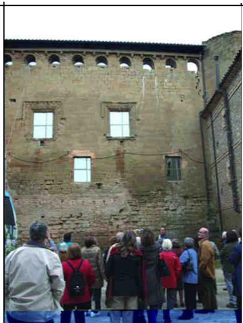
Castell de Concabella.

La jornada va finalitzar a Sant Salvador, església romànica del segle XII poc coneguda i especialment interessant per la forta empremta deixada pels picapedrers de l'escola lleidatana.