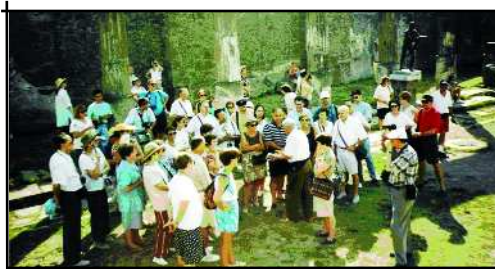
Pels carrers de Pompeia