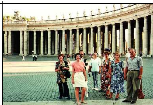
A la Plaça de Sant Pere del Vaticà