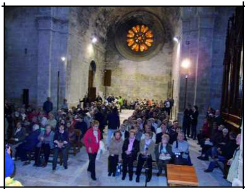
Pla de Santa Maria

L'edifici té unes estructures amplíssimes i exemptes de decoració. Malgrat això, els espais són amplíssims i, per entendre-ho, agafarem alguns exemples: el dormitori té arcs de diafragma apuntats i sostre de fusta de dos vessants; l'aula capitular té una volta de creueria sostinguda per quatre columnes, i la sala dels monjos, més tard celler, és molt alta i de grans espais damunt dues gruixudes columnes.