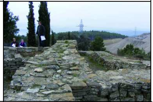
Poblat Ibèric del Cogulló