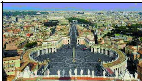
Des de la cúpula de Sant Pere

El Capitoli era un dels set turons de Roma, on s'ubicava el centre religiós i polític de l'antiga república romana. La plaça on està situat va ser dissenyada per Miquel Àngel, i està flanquejada a dreta i esquerra pels dos palaus bessons: la seu de l'Alcaldia de Roma i els Museus Capitolins on s'hi conserva l'estàtua