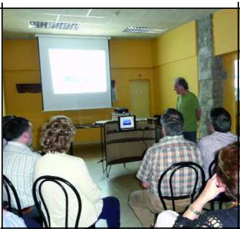
Tardes als Carlins.

Realment esperem que aquest moment crític que hem passat, com a conseqüència de la crisi econòmica, s'estabilitzi i ens permeti tirar endavant noves iniciatives i activitats relacionades amb els nostres pilars: art, història i cultura. Pel que fa als socis ens agradaria i treballarem perquè participin més en el si de l'entitat, a banda d'assistir a les diferents sortides i activitats. Podríem dir que el futur de les entitats, en general, és bastant incert perquè a la població cada vegada li costa més involucrar-se en associacions, agrupacions... Però nosaltres continuarem fent la feina com fins ara i intentarem trobar noves maneres per cridar l'atenció de la gent.