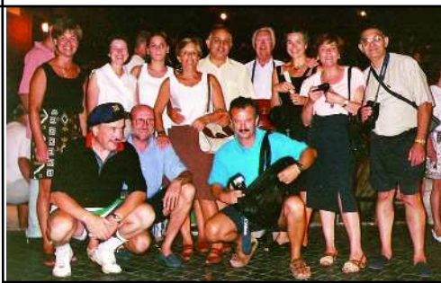
Roma de nit

Ja cap al tard, arribàvem a Roma. Per als que la visitàvem per primera vegada, l'entrada va ser emotiva: la ciutat eterna, la capital de l'Im-