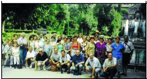
Villa de Tivoli

Fem parada a Pisa a dormir, i res més especial per acomiadar el viatge que una visita a la Plaça del Miracle: amb la torre inclinada, el Duomo, i el Baptisteri, que amb la il·luminació nocturna és d'una bellesa aclaparadora.