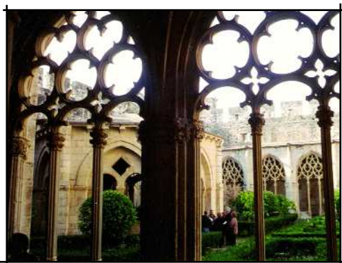
Claustre de Santes Creus

Després de dinar ens vam dirigir al Pla de Santa Maria per fer una visita a l'església de