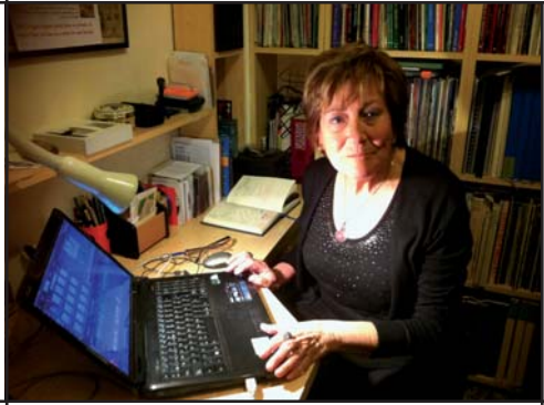
La Carme en el seu espai de treball quan coordina el Butlletí.

que et permet conservar amb el pas dels anys ja que les paraules se les emporta el vent.