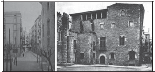
Casa que allotja el Museu d'Història de la Ciutat