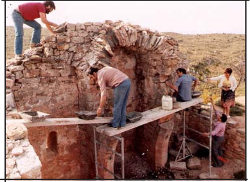
Treballs de neteja i consolidació de les restes de l'església de Sant Miquel de la Grevalosa, al municipi de Castellfollit del Boix. Any 1982.

Cultural, manresana i dedicada a l'art. Penso que aquests són els tres àmbits que s'haurien de potenciar des de l'entitat. Cultural perquè és una entitat que amb els anys ha ocupat el seu propi espai dins del teixit cultural de la societat. Manresana perquè és un grup d'amics