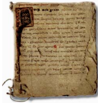
Exemplar d'un Ars dictaminis , de Guido Fabo (Barcelona, Arxiu de la Catedral, Ms. 179,1. (130 x 110 mm.).