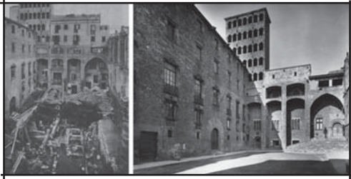
Plaça del Rei

dats- per substituir-los per construccions neo-gòtiques (al marge que el nou estil gòtic guardés relació o no amb l'original gòtic català) o bé per traslladar en el seu lloc altres edificis antics. Aquesta última fou l'opció adoptada a la Plaça del Rei quan el 1928 es comença l'enderrocament dels habitatges per col·locar l'anomenada Casa Padellàs, edifici del s.XVI, que havia quedat a l'altre costat de la Via Laietana (oberta com a via principal a principis del s.XX).