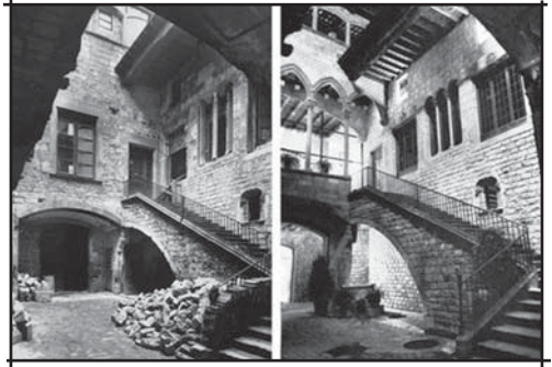
Palau Berenguer d'Aguilar al carrer Montcada

Un altre exemple d'intervenció arquitectònica es troba al carrer de Montcada, essent el Palau Berenguer de Aguilar (actual museu Picasso) una mostra de la voluntat de crear una imatge de Barcelona monumental i amb prestigi