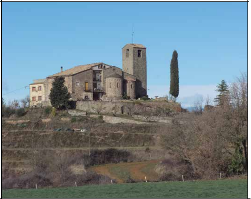
Sant Feliu de Terrassola

aquesta va trigar dos anys en arribar, temps en què l'impacient sacerdot va aprofitar per repicar la decoració interior. Entre 1971 y 1977, el que en aquell moment era el Servei de Catalogació i Conservació de Monuments de la Diputació Provincial, va realitzar importants obres de restauració durant les quals es va literalment “inventar” l'absis sud, ja que de l'original tan sols quedaven unes poques restes de la base, es van netejar els murs, es va reconstruir l'antiga portada meridional i es va refer part de la nau nord. Fotografies de 1967 i anteriors fan palès que l'absis septentrional