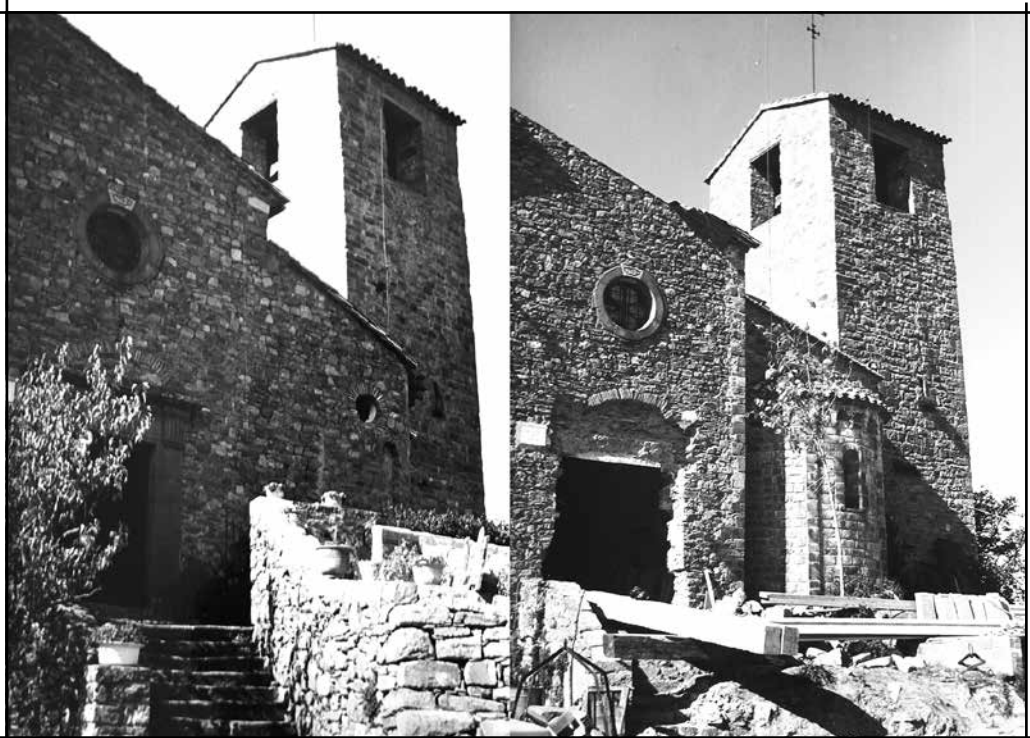
La capçalera de Sant Feliu de Terrassola en 1968 amb l'absis nord original (esquerra) i 1974 amb l'absis reconstruït (dreta)

Sant Feliu de Terrassola, el “Frankenstein romànic del Bages”, es un altre exemple evident de com no ha de tractar-se ni gestionar-se el patrimoni i una lliçó de la qual hem d'aprendre de cara al futur.