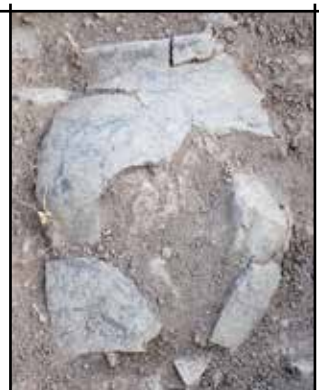
Olla grisa del segle XI-XII provinent de la domus de Torre

El següent nivell (segles XII-XIV) correspon al gran moment de l'edifici, quan l'antiga torre del segle XI s'amortitza i es construeix el gran cos rectangular, que de fet és una nova torre o sala. Es tracta d'una estructura de planta quadrada, amb gruixuts murs disposats en grades que delimiten la "sala" central, i una sèrie d'habitacles que envolten aquesta estructura per les bandes de migdia, ponent i tramuntana, i que formen dependències annexes de la sala central, tot i que no semblen tenir comunicació amb ella. Algunes d'aquestes estances podri-