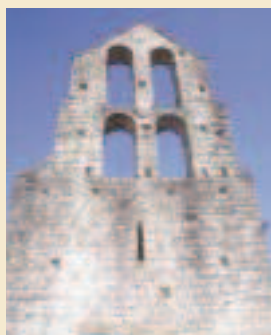
Sant Pere de Vallhonesta (Sant Vicenç de Castellet)