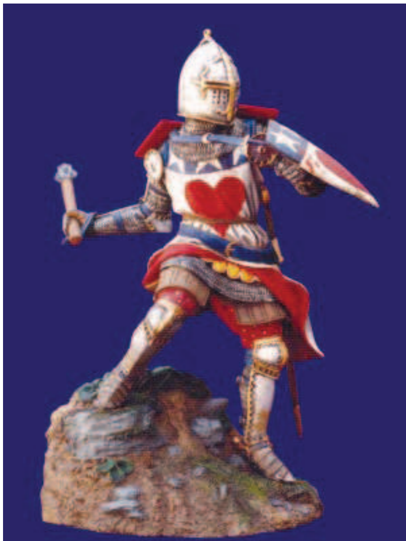
SIR ARCHIBALD DOUGLAS