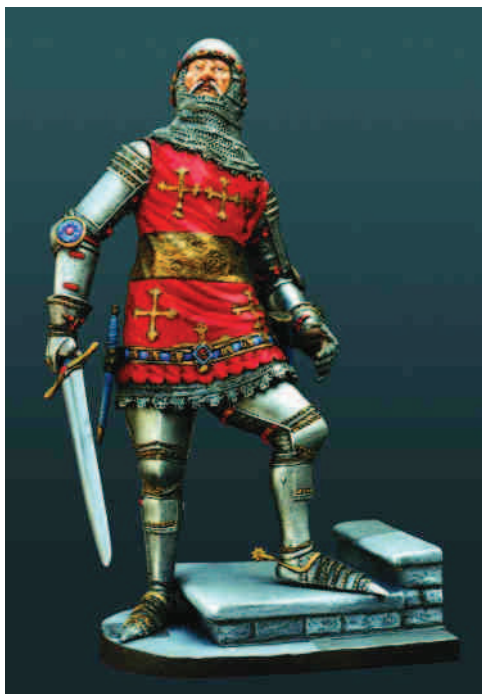
Thomas Beauchamp, comte de Warwick (1345-1401)

Pel que fa al casc, cal dir que cap a l'any 1420 el gran elm i el bacinet foren substituïts, en part, per l'elmet, que cobria tota la testa, i per la celada, que es complementava amb una visera i una bavera. També aparegueren altres cascs, com el barruer, que s'utilitzà a partir de finals del segle XIV, i la barreta, introduïda a principis del XV. En Tirant lo Blanc (1490) s'esmenta sovint el bacinet, fet que evidencia la continuïtat del seu ús durant aquest segle.