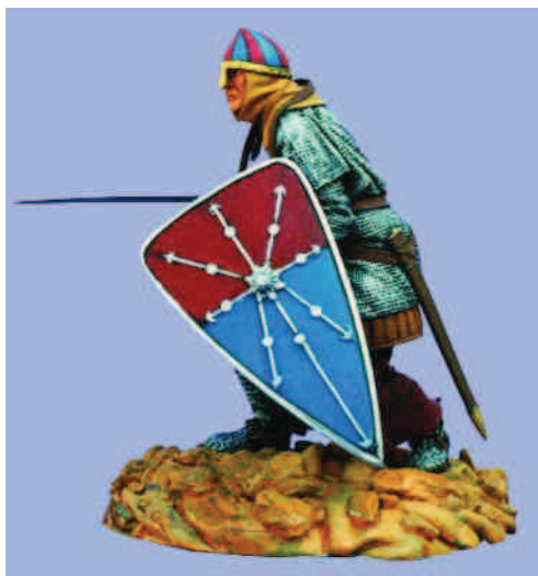
Cavaller normand (segle XII)

Cap a finals de segle es produïren un seguit de canvis que afectaren globalment l'arnès del cavaller. Aquesta reordenació de l'armament és la que s'imposarà i es generalitzarà al llarg del segle XIII.